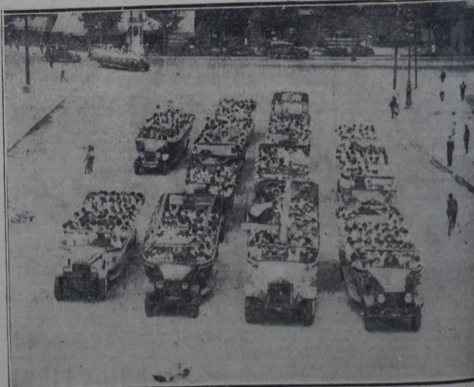
LOS NIÑOS EN EL MOMENTO DE INICIAR LA EXCURSION