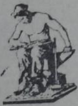
"Educar al soberano", Domingo F. Sarriente.